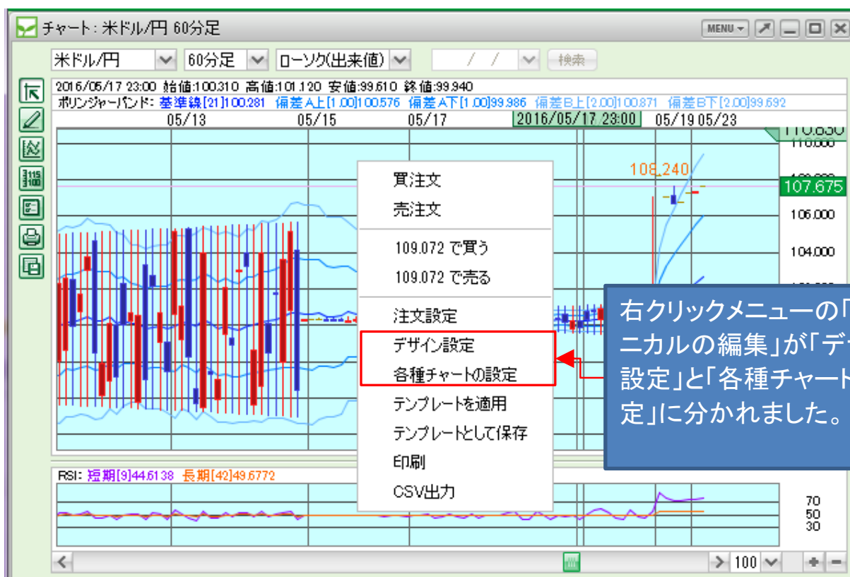
①右クリックメニュー⇒デザイン設定